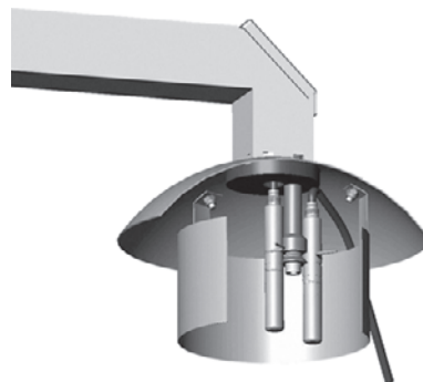
Zur Kalibrierung lässt sich die portable Referenzsonde HMP77 einfach neben der Sonde des HMT337 anbringen.

Korrekte Feuchtemesswerte sind z. B. für die Verkehrssicherheit besonders wichtig: auf Flughäfen und auf See ebenso wie auf den Straßen. Sie sind unter anderem unabhängig für die Vorhersage von Nebel und Frost.