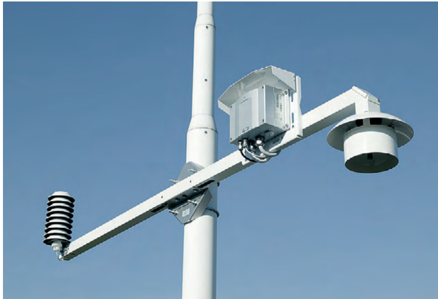
Der HMT337 mit beheizter Sonde ist unter Verwendung des Montagesatzes HMT330MIK die richtige Wahl für zuverlässige Feuchtemessungen im Freien.

Der Vaisala Montagesatz HMT330MIK ermöglicht die Installation des Vaisala HUMICAP® Feuchte- und Temperaturmesswertgebers HMT337 im Freien, um zuverlässige Messungen für meteorologische Zwecke zu ermöglichen.