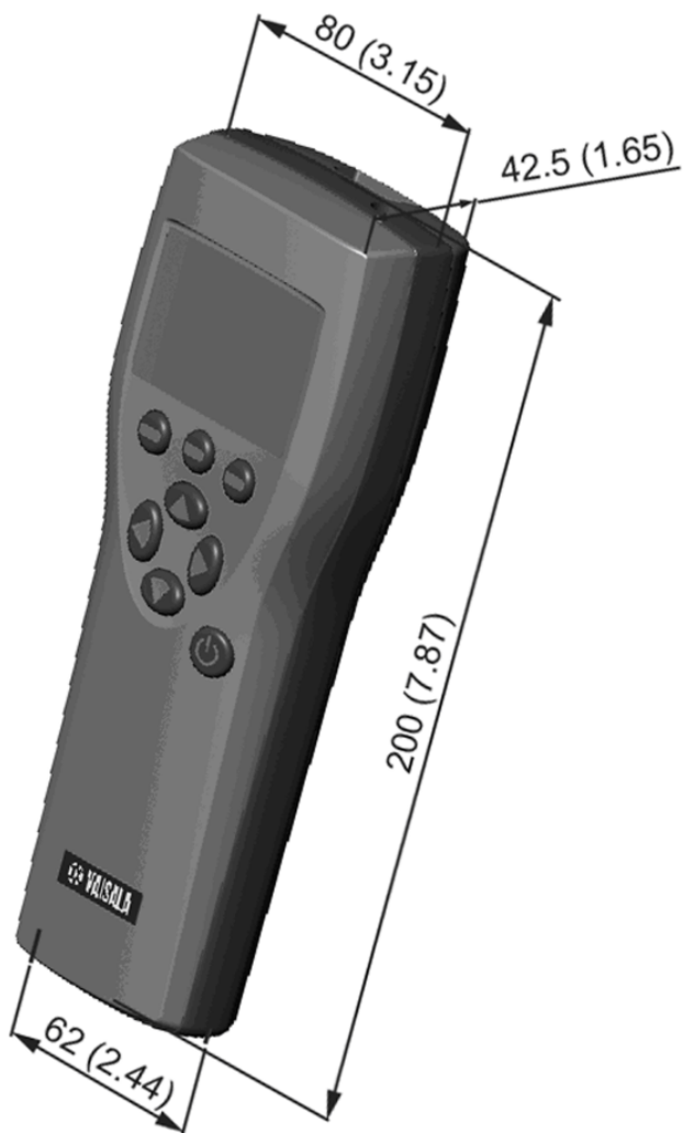
Abmessungen Universalmessgerät in mm