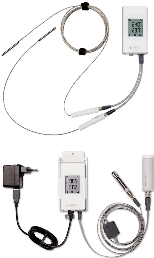
RFL100 mit zwei TMP115 Sonden (oben) und mit GMP251 Sonde und HMP110 Sonde (unten)

1) Siehe die Datenblätter der Sonden für sondenspezifisches Zubehör.