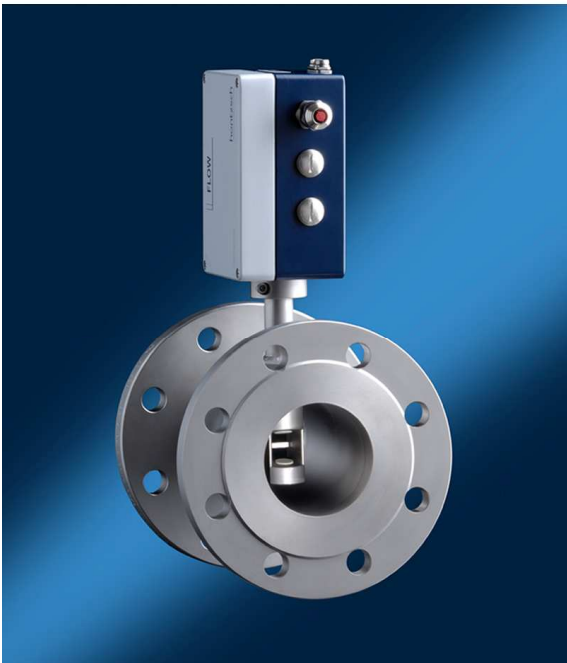
VA DI ... ZG1