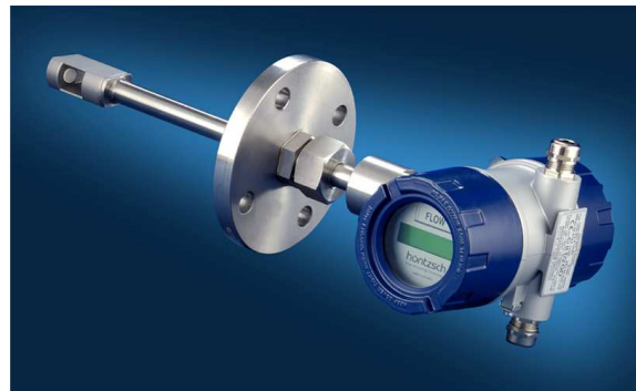
VA40 ... ZG8 Ex-d