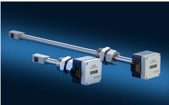
VA40 ... ZG7