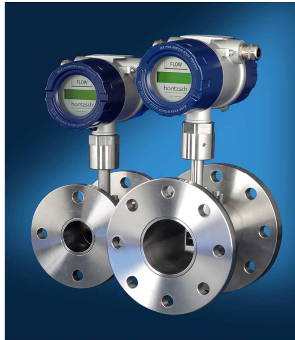
VA DI ... ZG1 Ex-d