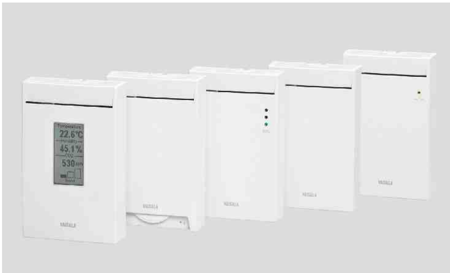
Fühler der Serie GMW80.

Die Vaisala CARBOCAP™ Kohlendioxid-, Feuchte- und Temperaturfühler der Serie GMW80 basieren auf einer neuartigen Technologie für noch genauere und zuverlässigere Messungen. Die Raumfühler ermöglichen CO 2 -Messungen bei Standardanwendungen mit bedarfsgeregelter Lüftung. Eine Temperaturmessung ist immer in den Fühlern der Serie GMW80 integriert. Optional verfügbar sind ein Potenziometer für den Temperatur-Sollwert, eine Feuchtemessung, ein Relais und eine LED-Anzeige für das CO 2 -Niveau, um Ihnen die notwendige Flexibilität für unterschiedliche Projekte zu bieten. Die CARBOCAP™ Sensoren liefern unmittelbar nach dem Einschalten exakte CO 2 -Messungen. Da diese über eine integrierte Referenzmessung verfügen, benötigen sie keine lange Vorlaufzeit, um genaue Messwerte zu liefern. Nach Einrasten des Gehäusedeckels kann der ordnungsgemäße Betrieb sofort überprüft werden.