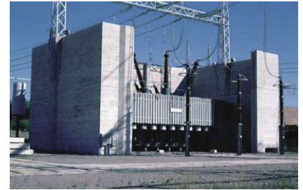
Die Onlinemessung der Ölfeuchte ist ein wichtiger Bestandteil von umfassenden Programmen zur vorbeugenden Wartung von Transformatoren.