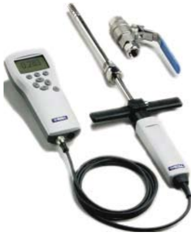
Vaisala HUMICAP® portables Ölfeuchtemessgerät MM70