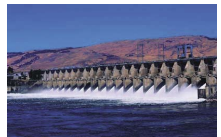
Die Wartungskosten von Turbinen zur Stromerzeugung lassen sich durch Echtzeitüberwachung der Feuchte im Turbinenschmieröl und den Hydraulikflüssigkeiten maßgeblich verringern.